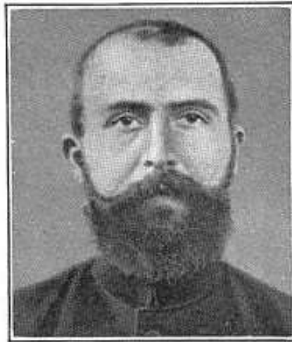
3. Mediterran, westisch: Korse.