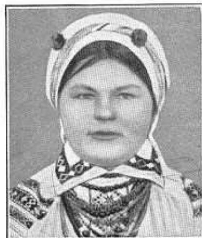
5. Ostbaltisch, helle Ostrasse: Ukrainische Wolhynierin.