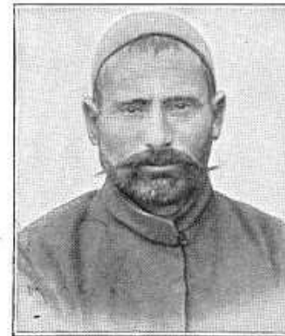
6. Türke aus Karahissar.