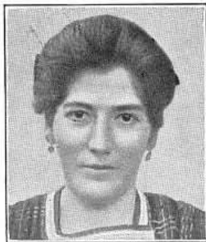
2. Dinarisch: Tirolerin.